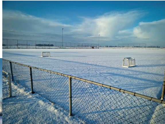
Dank Edwin Heerding voor deze mooie foto's!